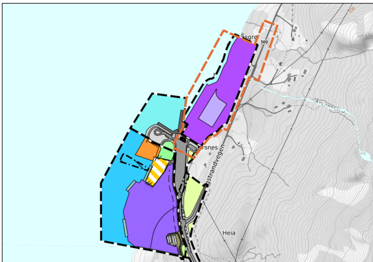
Figur 1 Utsnitt frå gjeldande reguleringsplanar i området:

Sør for planområdet ligg detaljreguleringsplan for 70/3 og 5 og 81/ 195, 208 og 209 - Årsnes industr-område – Løfallstrand - planID 20130003, med hovudføremålet næringsareal og hamneområde i sjø. Areala i området er regulert til næring, privat tenesteyting/næring, kai, hamn, småbåtanlegg, friområde, vegetasjonsskjerm og samferdsføremål.