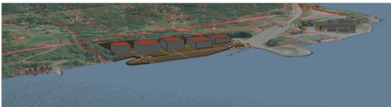
Figuren illustrerer mogleg utbygging

Det er utarbeidd eit forprosjekt for utviklinga av næringsområdet som skal danne grunnlaget for detaljreguleringa. I avsnitt om planlagt situasjon gjev ein att skisseløysing for området (næringsareal, kaiareal og hamn) som beskrive i forprosjektet.