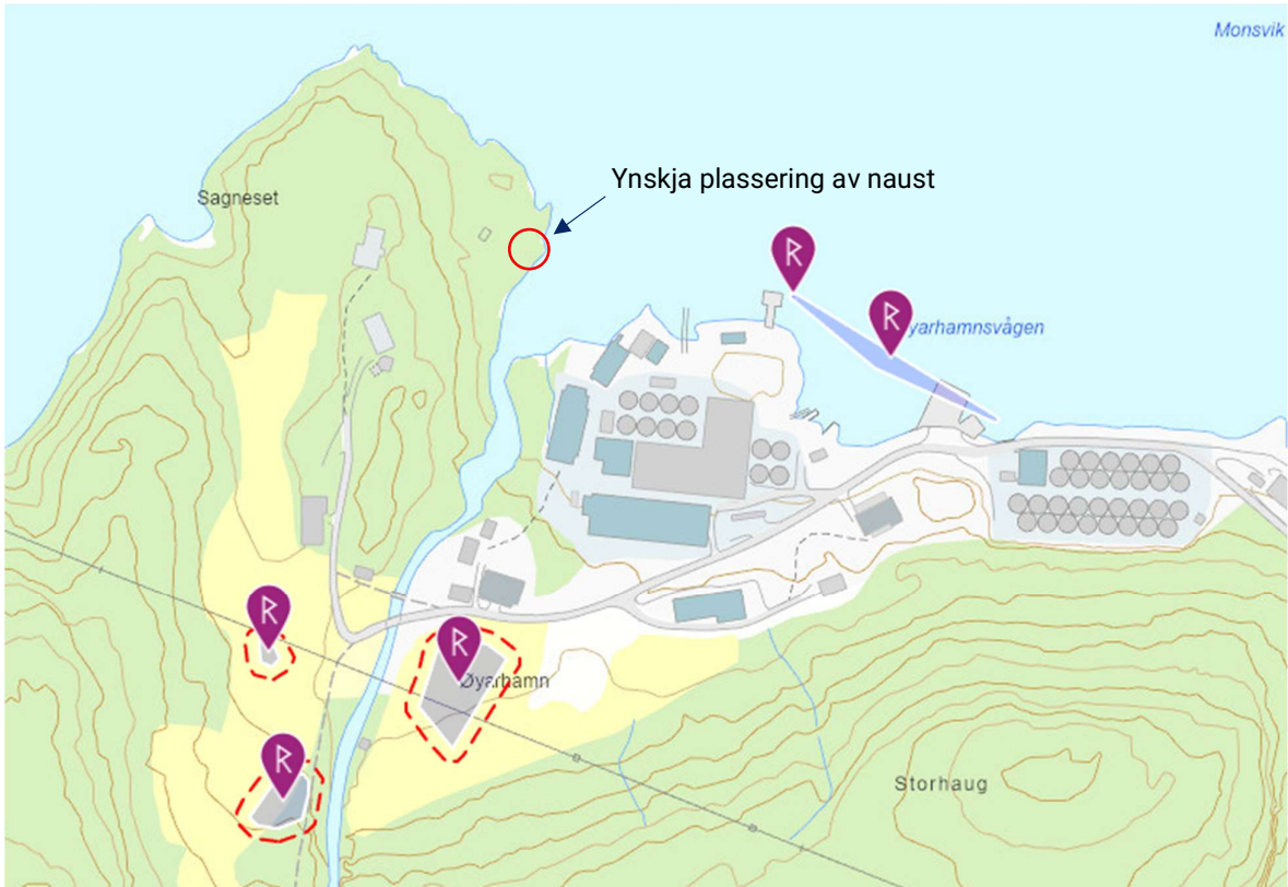
Figur 8 - Registrerte kulturminne i området, med ynskja plassering av naust.

bakar, posthus og dampskipskai 1 . Vidare sør for området er det gjort fleire registreringar av busetnad- og aktivitetsområde.