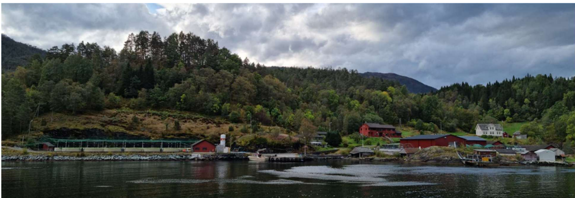
Figur 4 Foto som synar eksisterande bygningar i 2023.

Det var søkt om løyve til riving av nausta i 2022 for å klargjere tomte for utviding av settefiskanlegget.