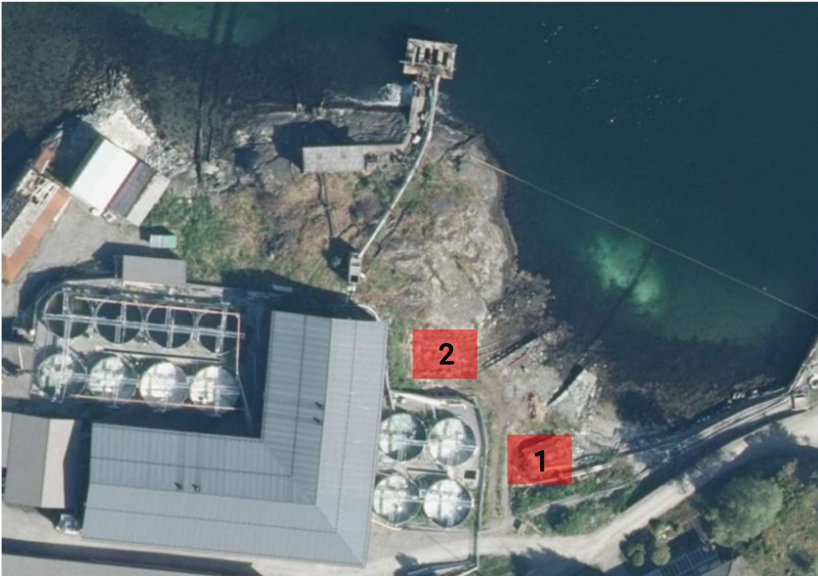
Figur 5 Tidlegare plassering av nausta. Det er naust nr. 2 ein ynskjer å sette opp att no.