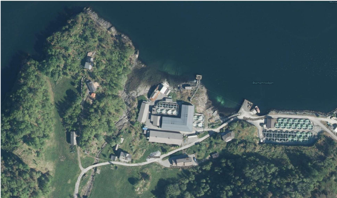
Figur 3 Flyfoto av settefiskanlegget, samt fritidsbustader og våningshus.

Øyarhamn ligg nord på Varaldsøy i Kvinnherad kommune. Øya består av både fritidsbustader og einebustader. Nord på Varaldsøy ligg settefiskanlegget til Mowi avd. Kvinnherad. Egedomen ved settefiskanlegget er i stor grad nedbygd, og ikkje tilgjengeleg for ålmenta, forutan ein kommunal veg til området. Som følge av ei utviding av anlegget vart to eldre naust demontert og lagra, med hensikt om å sette dei opp at i nærområdet. Det er naust nr. 2 som no skal settast opp at.