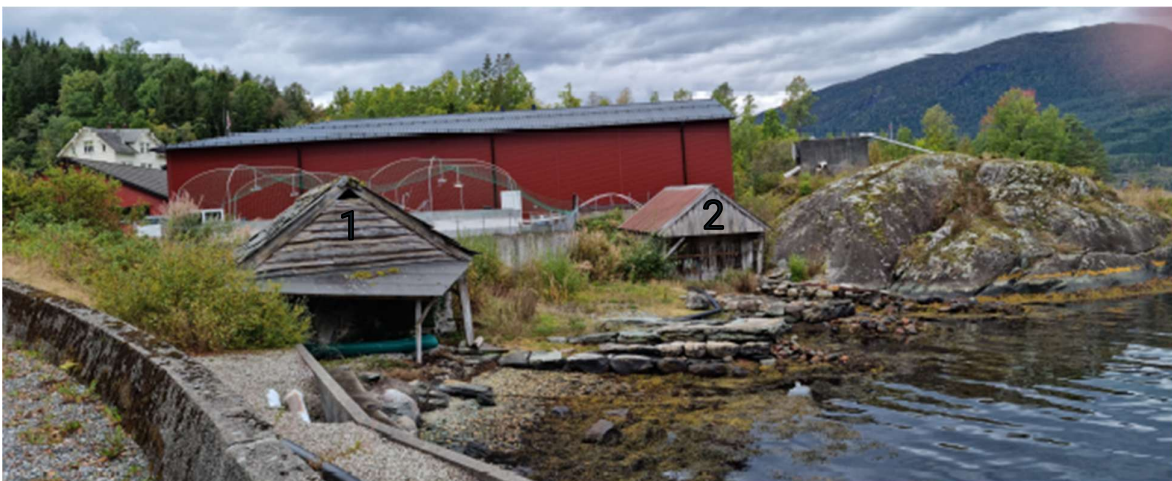
Figur 6 Nausta oppført ved settefiskanlegget før dei vart demontert og lagra.