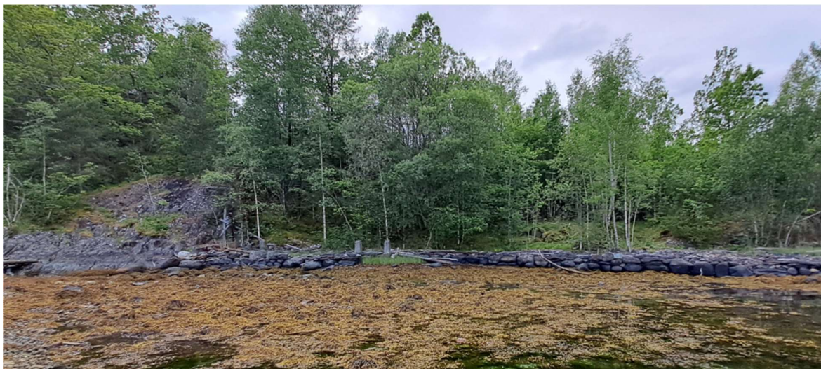
Figur 2 Ønska lokasjon for naustet.

Naustet er flytta (og lagra vekk) då settefiskanlegget på staden skal utvida, og det var soleis naudsynt å fjerne naustet innanfor området avsett til utviding av settefiskanlegget. Det er ynskjeleg å sette opp at det eine naustet der det frå gammalt av har stått ei sag.