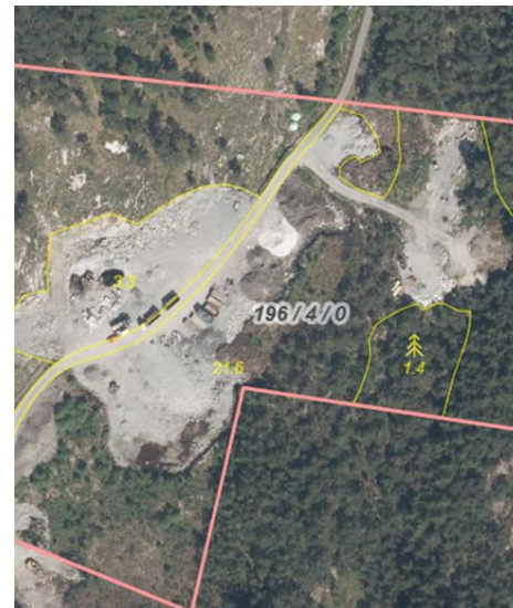
3 Arealet i 2024 (gardskart.no)

Når det gjeld søknaden frå 2017, har ikkje kommunen respondert på førespurnadar om innsyn. Tidlegare var han tilgjengeleg på postlista, noko han ikkje lenger er. Med utgangspunkt i andre dokument knytt til saka får ein noko informasjon om kvifor grunneigar har søkt om nydyrking.