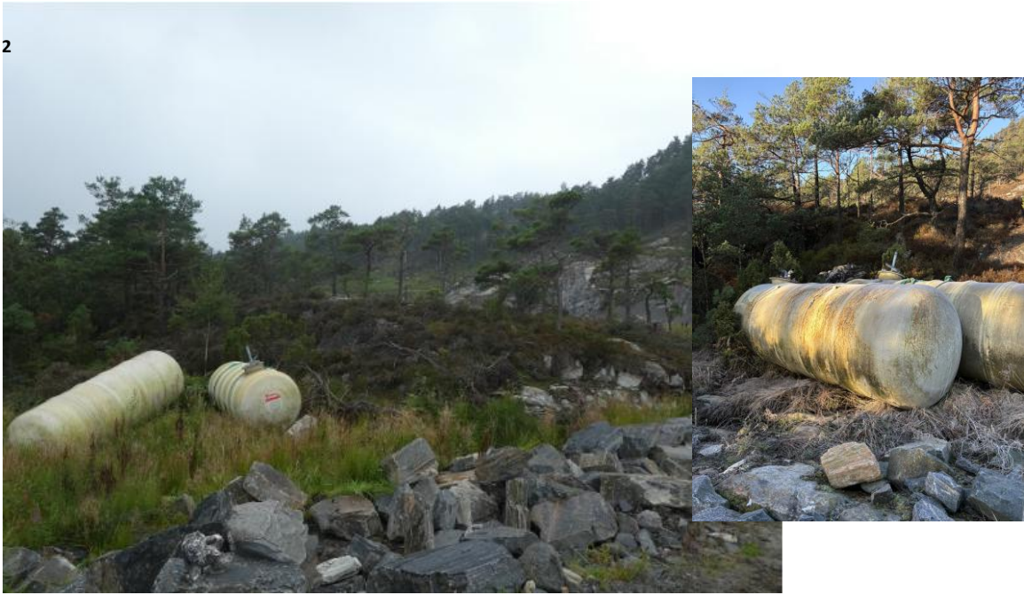
4 Disse har lege på området i alle fall i nærare 6år, bilete frå 2020 og 2026