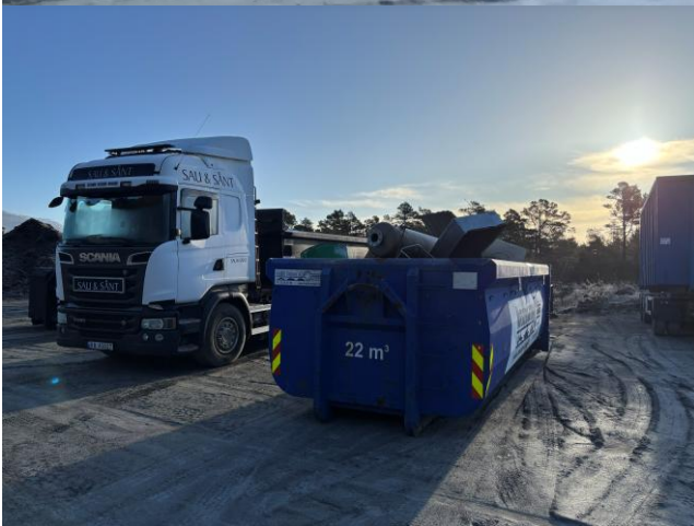
2 Bilete henta frå statsforvaltaren sitt tilsyn i 2020.