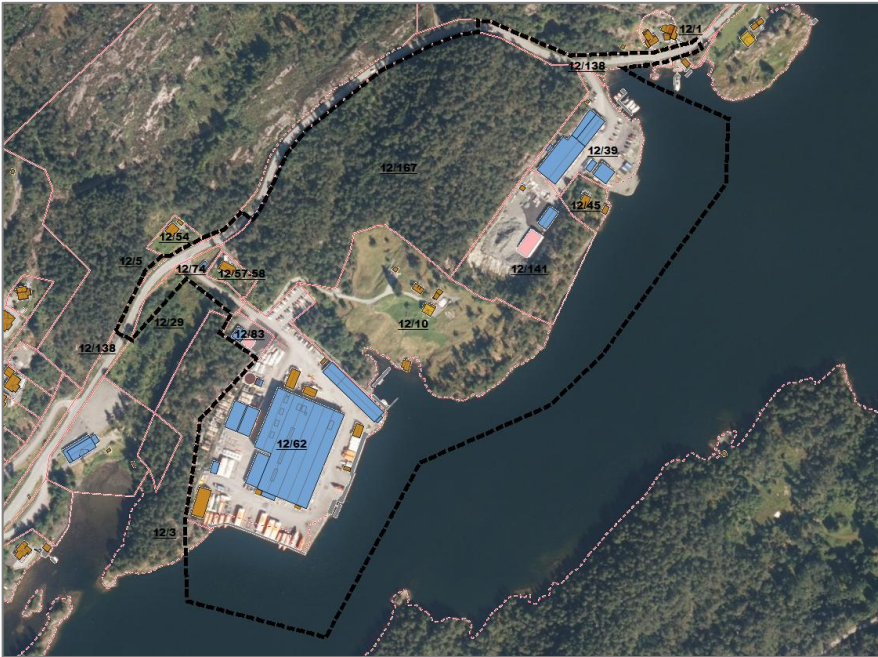
Illustrasjon planavgrensing. Sjå vedlagt plangrense for større versjon.