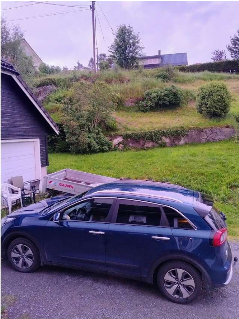
Bilde frå utgangsdøra mi, sørlege del av området som startar ved den grønne busken til høgre