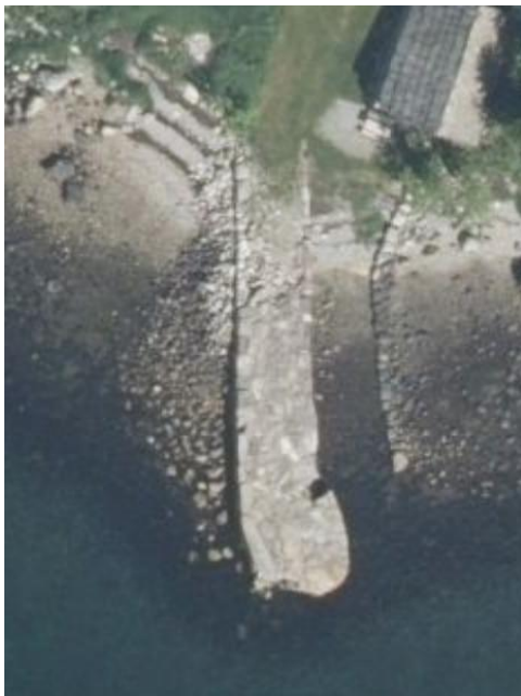
1 Satelittbilde Klosterbrygga

Me viser til tidlegare telefonsamtale vedrørende Klosterbrygga ved Halsnøy Kloster, der kommunen stadfesta at nødvendig vedlikehold av eksisterande anlegg ikkje er søknadspliktig etter plan- og bygningslova. Me er no i gang med nødvendig vedlikehalds- og sikringsarbeid på Klosterbrygga, då brygga over tid har fått omfattande skadar som følgje av storm, sjøgang og utvasking.