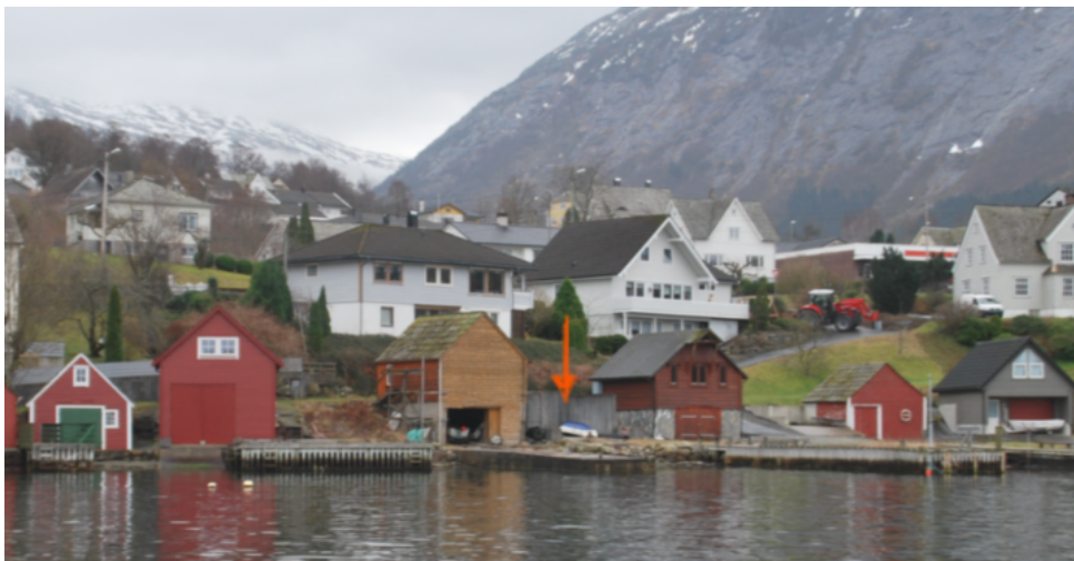
Plassering omsøkt tiltak

I område Na-06-01 er det i dag 14 naust som er bygd og det opplyst at det er plass til 4 nye naust. Jamfør kommuneplanen sine føresegn § 3.9.10. er det plankrav i naustområde med plass til meir enn 4 naust. Det er i utgangspunktet uheldig å fråvike eit plankrav. Ein reguleringsplan vil mellom anna sjå området samla og syta for naudsynte heilskaplege vurderingar og avklaringar. Ein dispensasjon i denne saka vil vidare føre til at plankravet for dei resterande 3 nausttomtane fell bort, slik at området kan byggjast ut utan reguleringsplan.