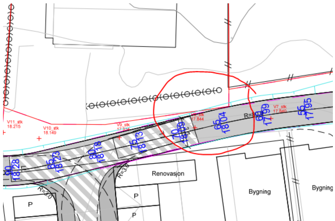
Figur 2 - utsnitt av vegteikning