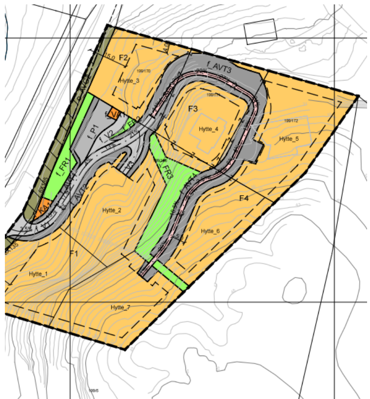
Reguleringsplan - Situasjon etter innsnevring til 1,5m. Linjeføring er lik