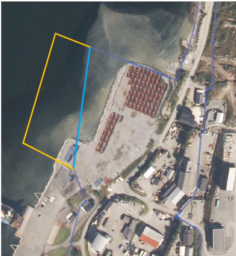
Gul linje i kartutsnittet viser ny plangrense, blå linje viser opphavleg plangrense (flyfoto).