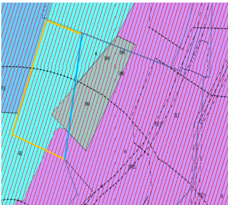
Gul linje i kartutsnittet (frå gjeldande arealdel) viser ny plangrense, blå linje viser opphavleg plangrense.

Endeleg detaljar er ikkje avklara enda og verknadane for utvidinga vil bli skildra i planframlegget. Råka partar vil kunne uttale seg til detaljane ved offentleg ettersyn av planen.