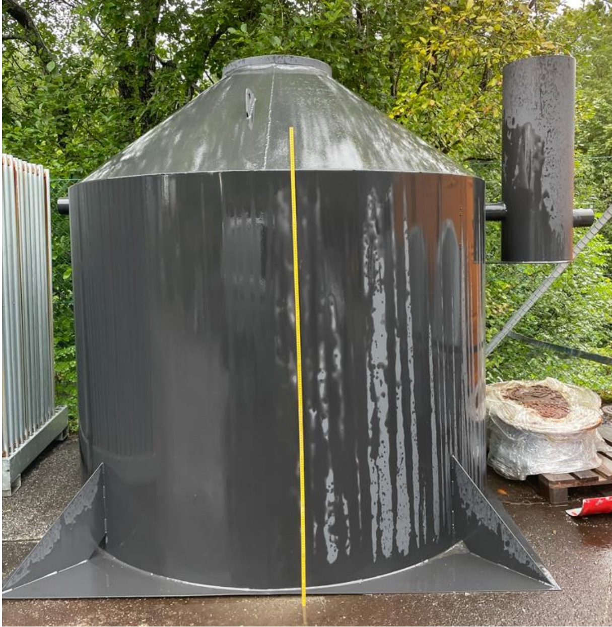
Størrelse på oljeutskiljar: B 2.6 L 2.6 H 2.6