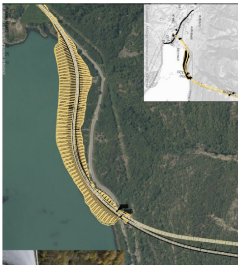
Mogeleg løysing for alternativ 3