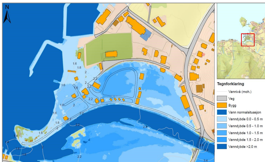
Figur 16 Flaumkart. Rabben feriesenter.

NVE har erosjonssikringsanlegg i Uskedalselva. Det meste av elvesida inn mot planområdet er sikra.