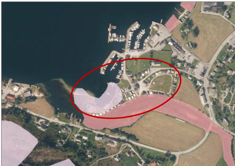
Figur 13 Kartlagde friluftslivsområde. Planområde synt med raud ring.

Planområdet ligg sentralt i nærleiken av Uskedalen sentrum. Gjeldande reguleringsplan visar badeplass. Det er kartlagde friområde innaføre planområdet.