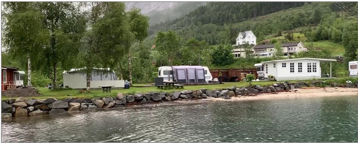
Figur 35 Strandsone, med store steinar som plastring