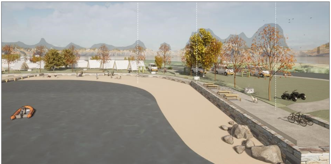
Figur 36 Illustrasjon av mogleg tilrettelegging av strandsone. JK Arkitektur