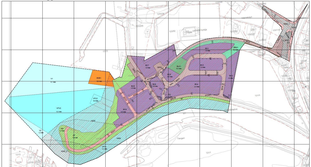
Figur 28 Plankart datert 12.12.2023