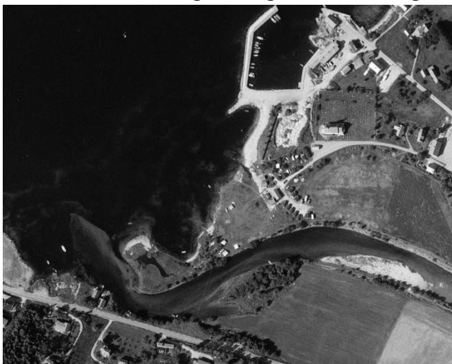
Figur 21: 1981

Stabilitetsforhold i strandsona har vorte vurdert. Elva fører med seg nye material ut i sjø, og sandbanken er i stadig endring. Bilete frå Norge i Bilder syner korleis endringa skjer: