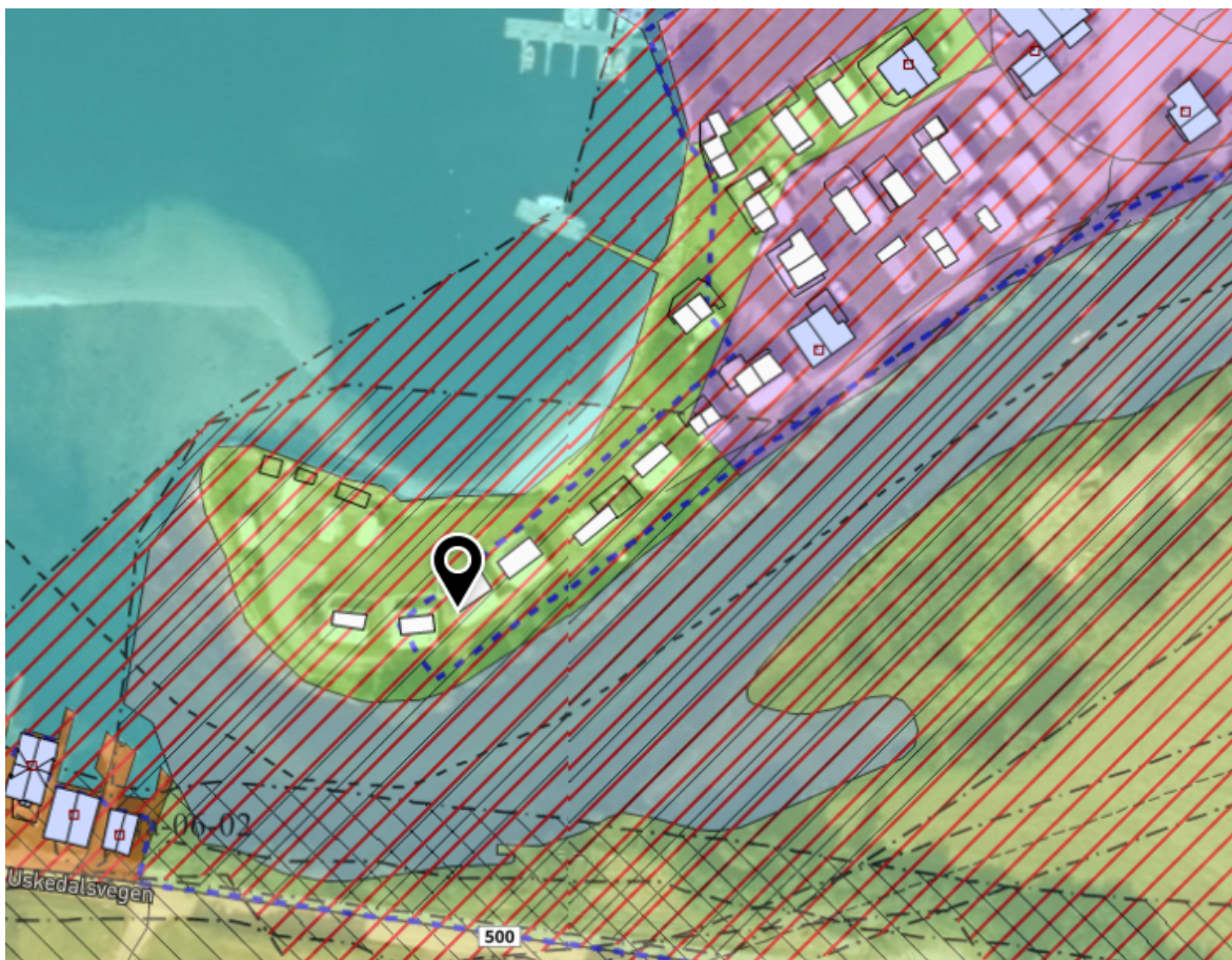
Utklipp frå kommuneplan med byggegrense og omsynssoner

I kommuneplanen er det sett ein omsynssone (H560_17) for bevaring naturmiljø langs Uskedalselva og rundt neset ved utløpet av elva. I denne sona er natur ei særskilt viktig interesse (jf. pbl. § 11-8 c, 1. ledd). Sona skal sikra levande og samanhengande natur- og kulturlandskap for framtida (jf. pbl. § 8-11 c, 3. ledd). Den ytste delen av elvedeltaet er sett av til LNF-formål. Det er sett byggegrense til sjø i planen som om lag samsvarer med kommuneplanen (stipla blå linje):