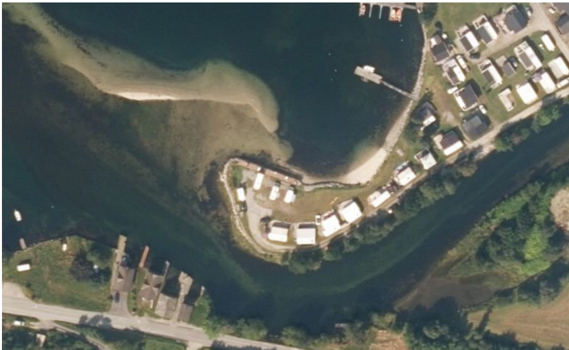
Flyfoto av elvedelta