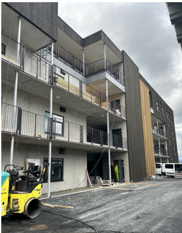
Fasade mot nord, viser heisområdet