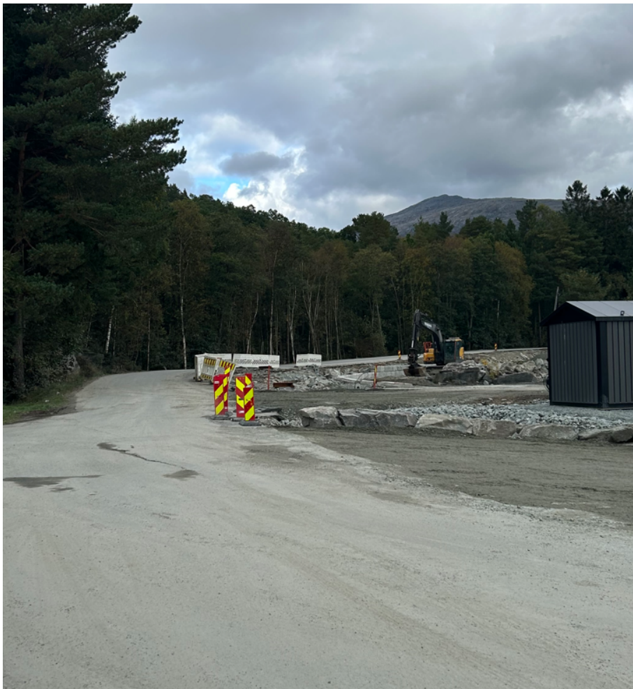
Tilkomstveg til området