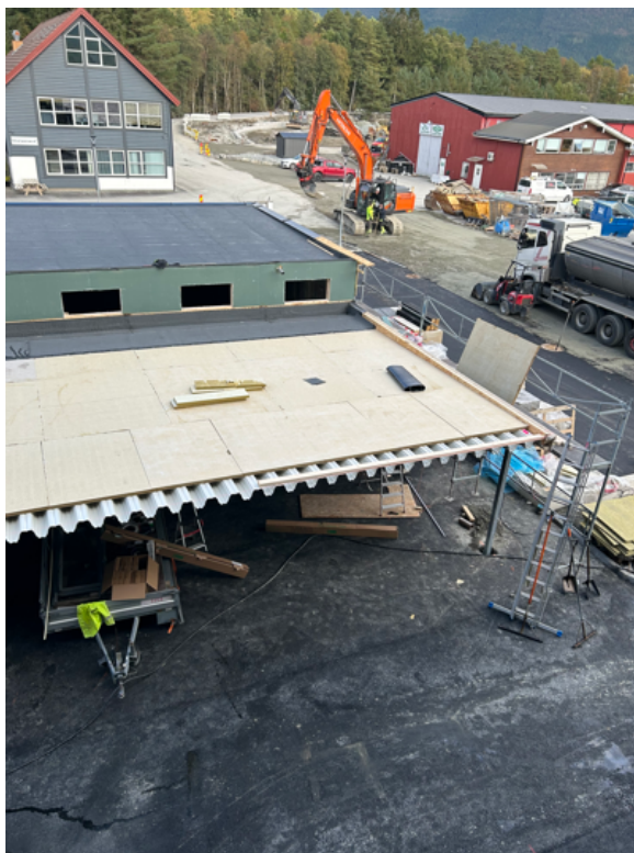
Carport/boder under arbeid