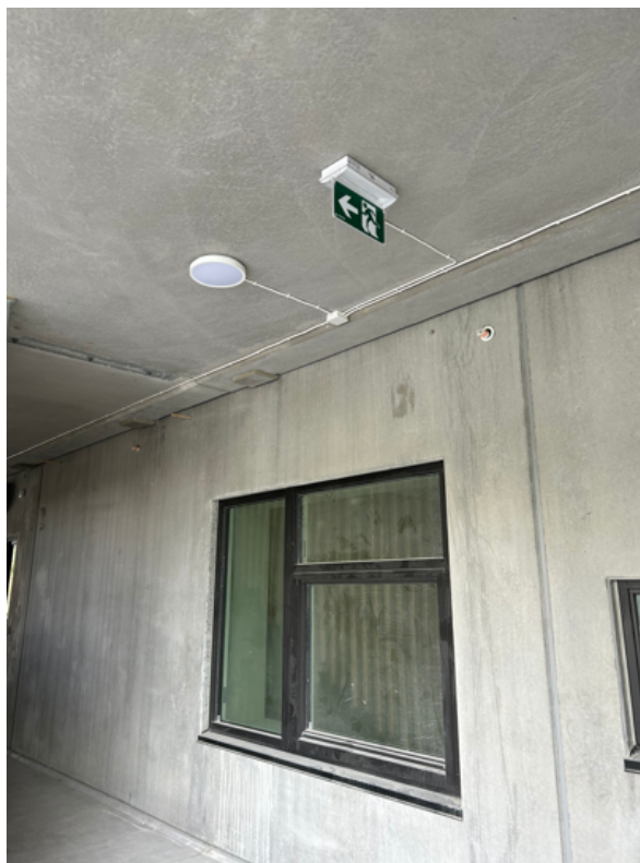
Skilt for rømming. Belysning som er sensorstyrt.