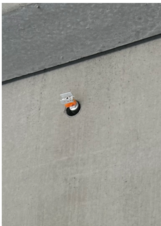
Dyse under montering