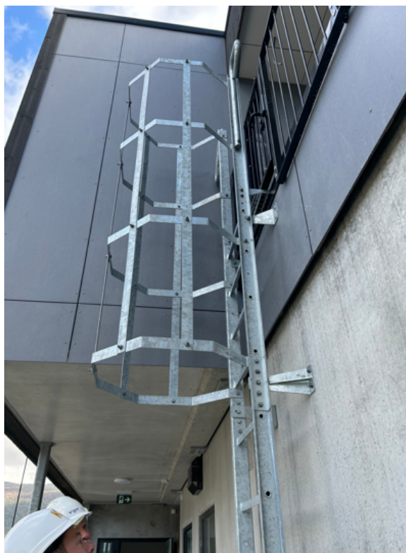
Trapp for rømming frå 4. til 3. etasje.