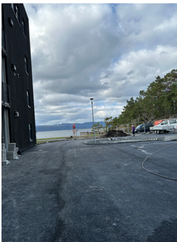
Asfaltering av uteområdet pågår