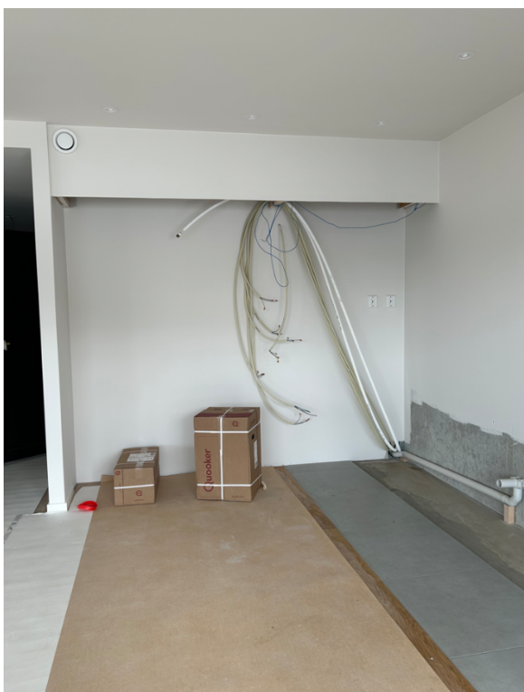
Kjøkken under arbeid