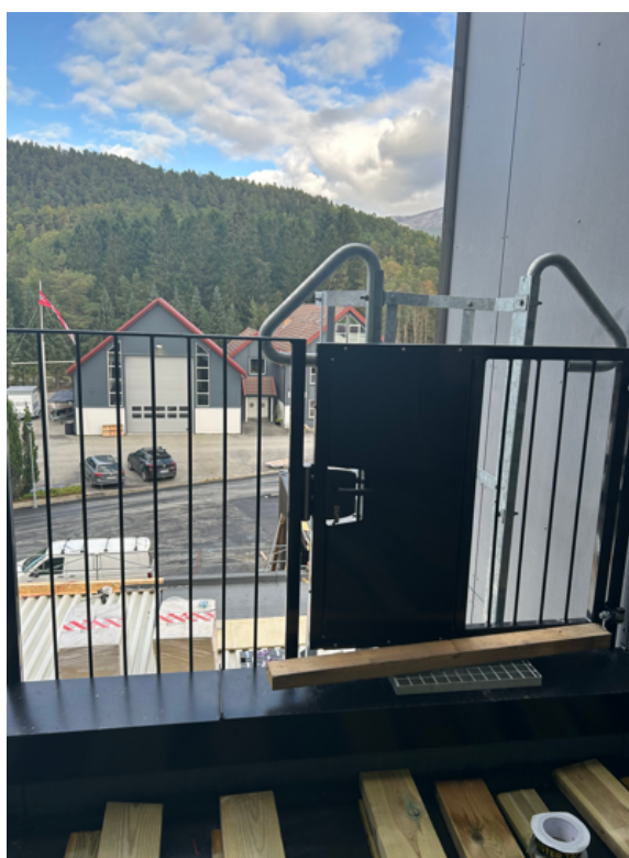
Port i 4. etasje for rømming til 3. etasje. Denne viser lås med nøkkel som kan hindre rømming.