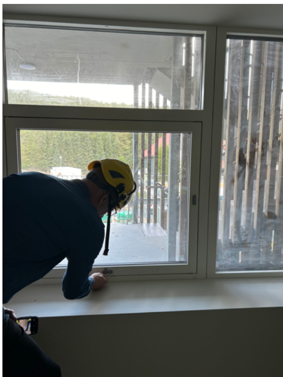
Vindauge mot svalgang