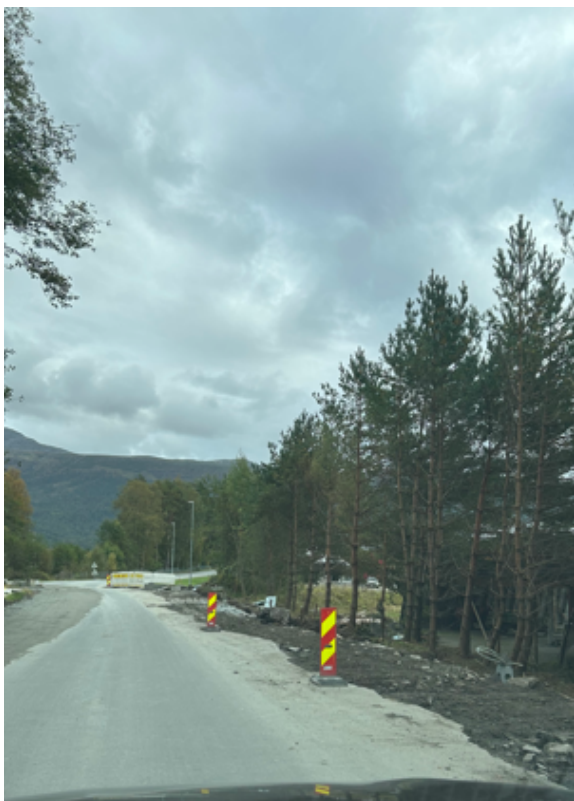
Mot kryss kommunal veg Bogsnes