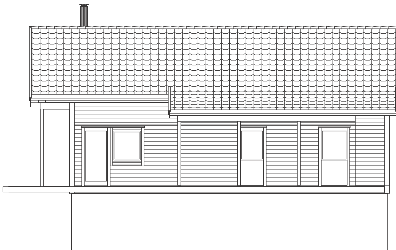
Fasade sør sørøst 1:100