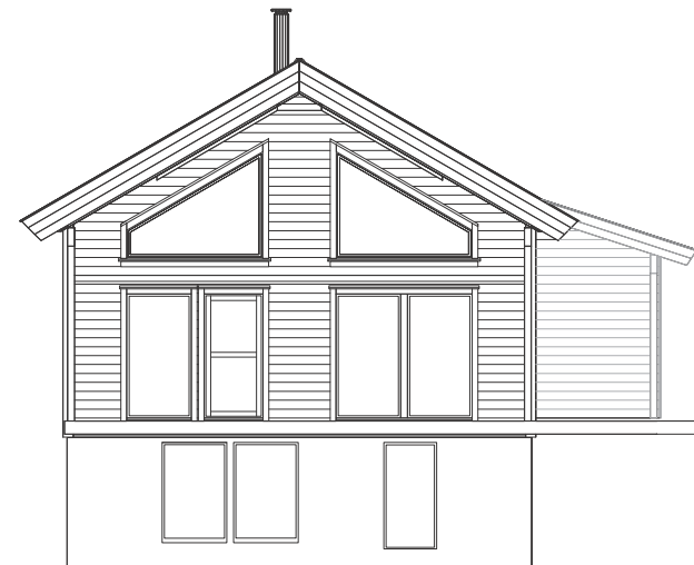
Fasade vest sørvest 1:100