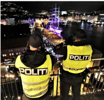
LTV 2024-2025 vest.pdf / versjon 1.0 / utgitt: nov, 2024