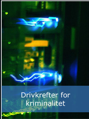
Drivkrefter for kriminalitet