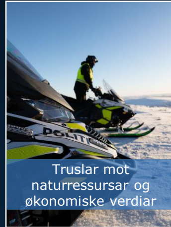
Truslar mot naturressursar og økonomiske verdier