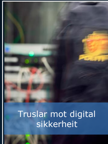
Truslar mot digital sikkerheit