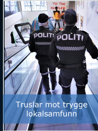
Truslar mot trygge lokalsamfunn