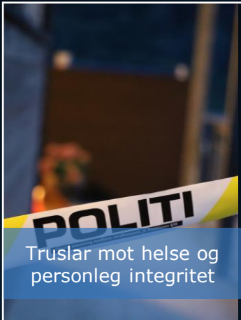
Truslar mot helse og personleg integritet