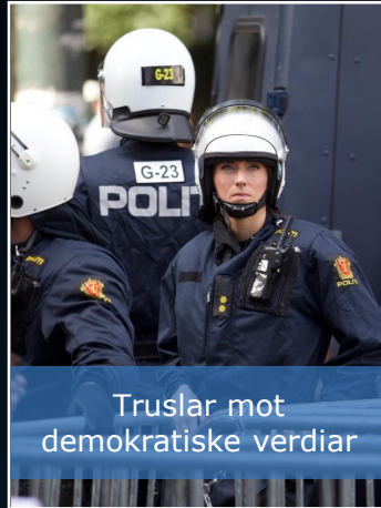
Truslar mot demokratiske verdier