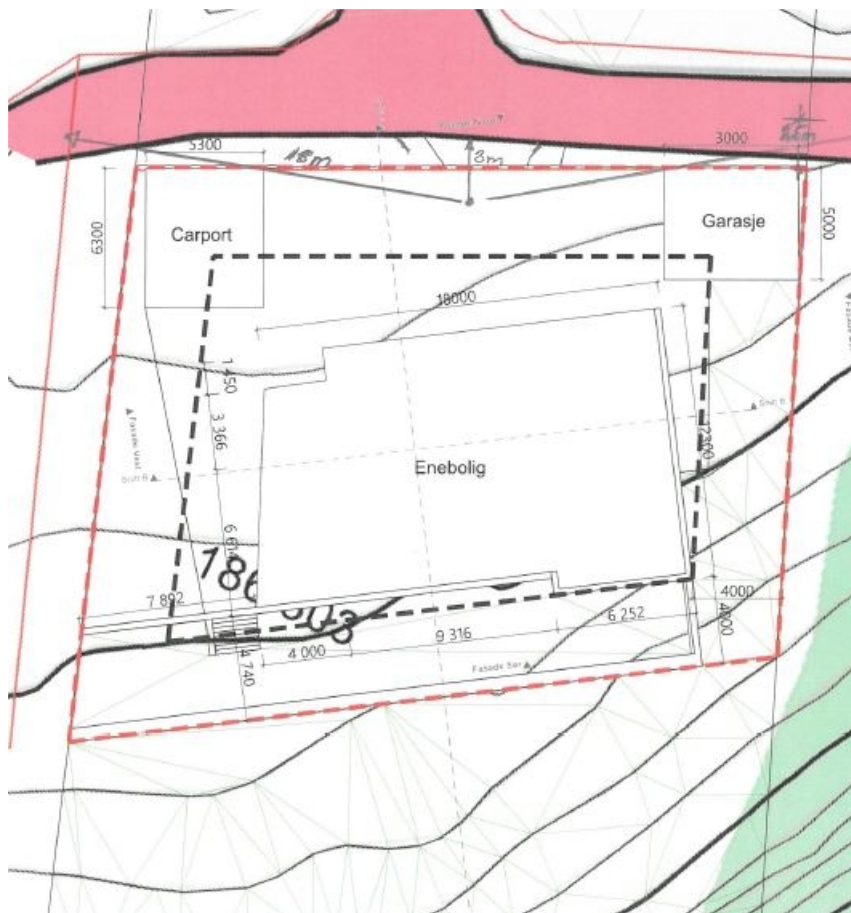
Utomhusplan, frå søknad