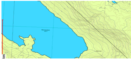
Figur 1 Oversiktskart

Det er søkt om dispensasjon frå gjeldande planar for å byggja uthus/vedbu på gnr/ bnr 125/1 – Mannsvatnet i Uskedalen. Bygget er ca 10 m 2 og er tenk oppført ved hytta tilhøyrande bruket. Merk at denne behandlinga berre omfattar dispensasjon.