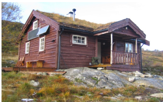
Figur 3 Eksisterande hytte