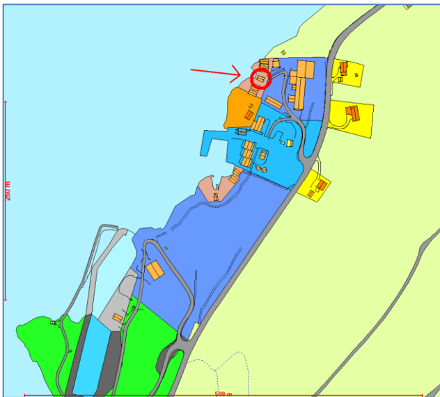
Figur 2: Situasjonsplan.

Omsøkt areal er kommuneplanlagt til naustområde i gjeldande kommunedelplan for Rosendalsområdet, vedteken 20.02.2003. Funksjonell strandsone er ikkje vurdert i samband med kommuneplanarbeidet, men arealet ligg truleg innanfor funksjonell strandsone. Strandsona er relativt tungt utbygd med naust og kaianlegg, likevel vil omdisponering til fritidsbustadar truleg føre til auka privatisering av strandsona.