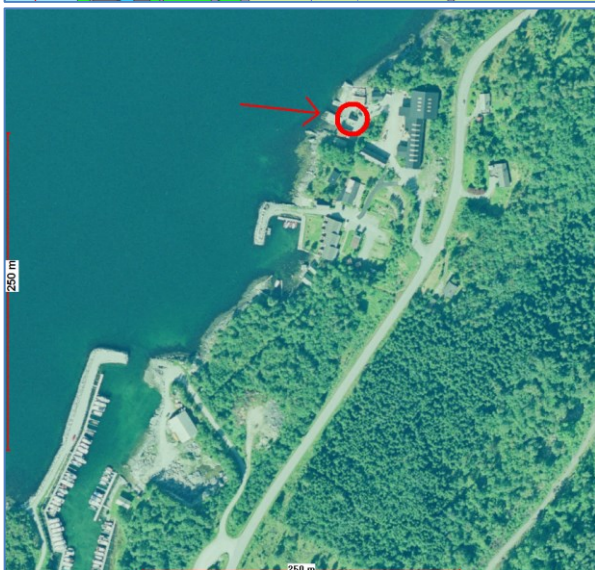
Figur 3: Kommuneplansituasjon og ortofoto.