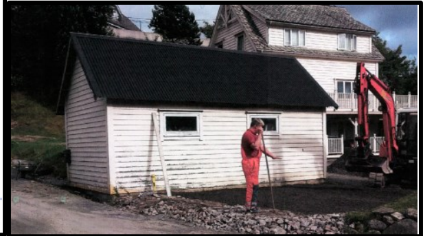
Gamalt garasje som stod der.